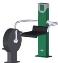
DF Sitzfahrrad Bike Fit Senior