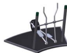
DF Crosstrainer Cardio Cross