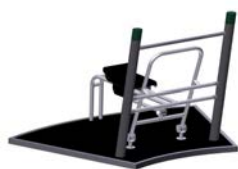
DF Rudergerät Cardio Row