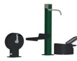
DF Gym Combi 3