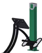
DF Rückentrainer Back Shape