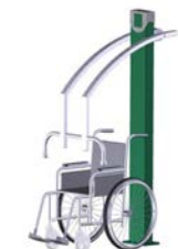
DF Schulterpresse Power Push Inklusiv