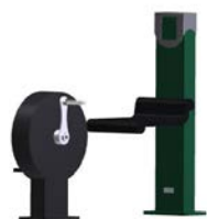
DF Sitzfahrrad Bike Fit