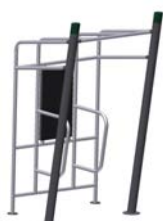
DF Bauchtrainer Multi Fit