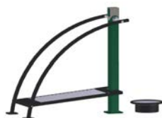
DF Gym Combi 9