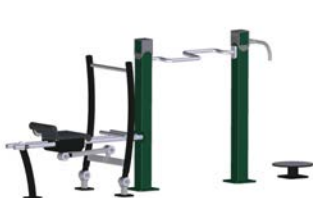
DF Gym Combi 1

* Produkte auch mit Gummiboden erhältlich.