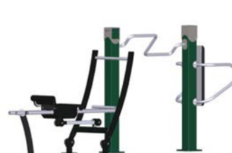
DF Gym Combi 7