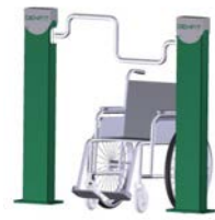
DF Handfahrrad Hand Bike Inklusiv