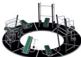
DF Fitnesszirkel Sportpoint