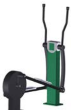
DF Crosstrainer Cross Fit