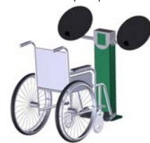
DF Schultertrainer Wax-On Wax-Off Inklusiv