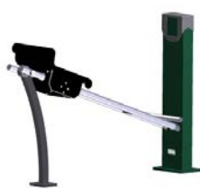
DF Beinpresse Leg Push