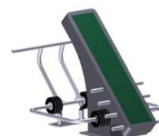
DF Oberkörpertrainer T-Bar