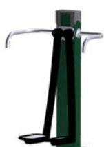
DF Hüftschwung Leg Wave