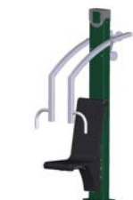
DF Schulterpresse Power Push