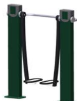
DF Beintrainer Wave Walk