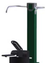
DF Stufentrainer Step Walk