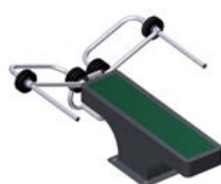
DF Oberkörpertrainer Pectoral