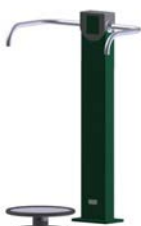
DF Hüfttrainer Balance Board