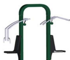
DF Multi Max 2