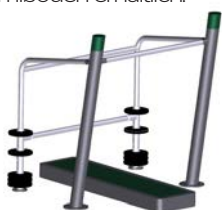
DF Drückbank Bench Press Low