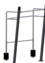
DF Beintrainer Squat