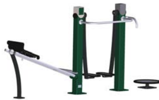
DF Gym Combi 2