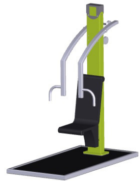
Mit eigenem Boden zum Aufdübeln oder Eingraben