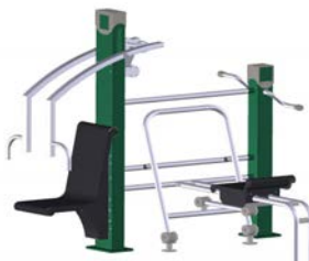
DF Gym Combi 6