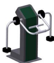
DF Armtrainer Preacher Curl