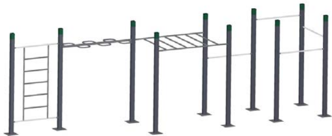
DF Fitness-Station Wave Monkey Bars