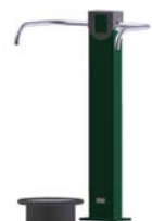
DF Ganzkörpertrainer Twist Out