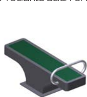
DF Bauchtrainer Abdominal

* Produkte auch ohne Gummiboden erhältlich.