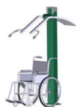
DF Armtrainer Power Pull Inklusiv