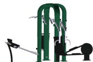
DF Multi Max 4