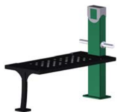
DF Bauchtrainer Ab Shape