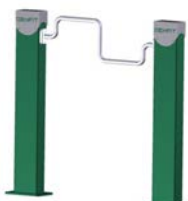
DF Handfahrrad Hand Bike