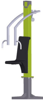
Mit Verankerungsrahmen zum Eingraben