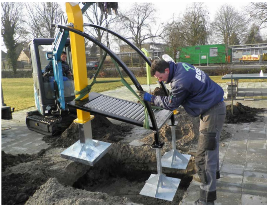
Gym - DF Laufband RunFit mit Verankerungsrahmen bei der Montage in weichem Boden