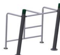
DF Oberkörpertrainer Dip Press