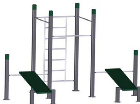
DF Fitness-Station Klimmzug/Bänke