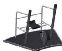
DF Sitzfahrrad Cardio Bike