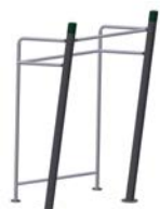
DF Klimmzugstange Chin Bar