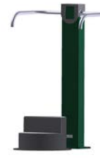
DF Stufentrainer Step Up