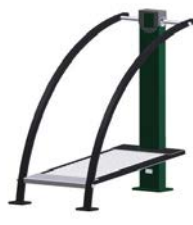
DF Laufband Run Fit