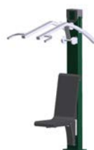
DF Armtrainer Power Pull