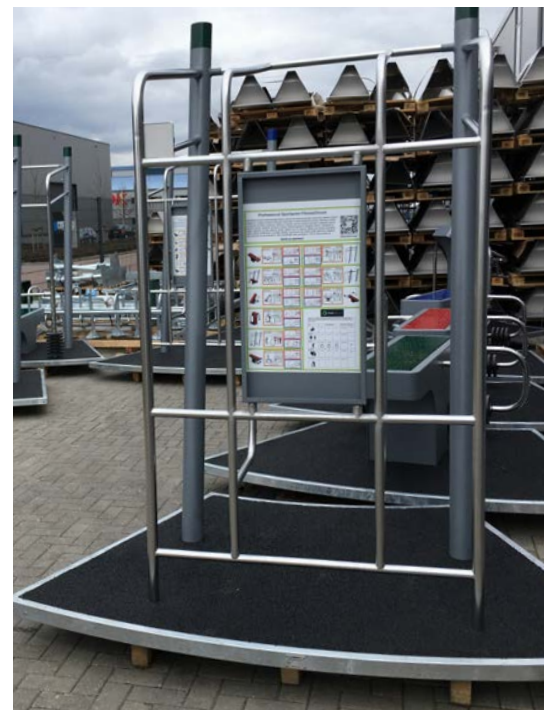
SportPoint mit eigenem Boden

Alle Denfit Produkte können entweder direkt auf Beton aufgedübelt oder mit einem Verankerungsrahmen eingegraben werden (kein Beton zur Befestigung notwendig).