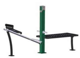
DF Gym Combi 8