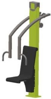
Direkt auf Beton zum Aufdübeln

Die Montage der Denfit Fitnessgeräte ist einfach und es wird kein Beton benötigt. Je nach Produkt-Serie sind drei verschiedene Verankerungsoptionen erhältlich: