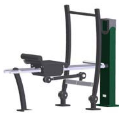
DF Rudergerät Row Fit