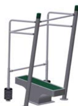
DF Drückbank k Bench Press