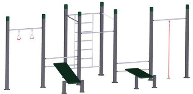
DF Fitness-Station Klimmzug/Bänke/Seil/Ringe